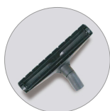
Bocchetta pavimenti polvere