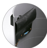
Dispositivo antischiuma (optional)