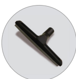
Bocchetta pavimenti liquidi