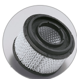
Filtro a cartuccia HEPA (optional)