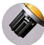
Cestello tendifiltro con galleggiante