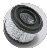
Filtro a cartuccia HEPA (optional)