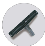
Bocchetta pavimenti polvere