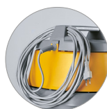
Gancio di fissaggio per cavo alimentazione